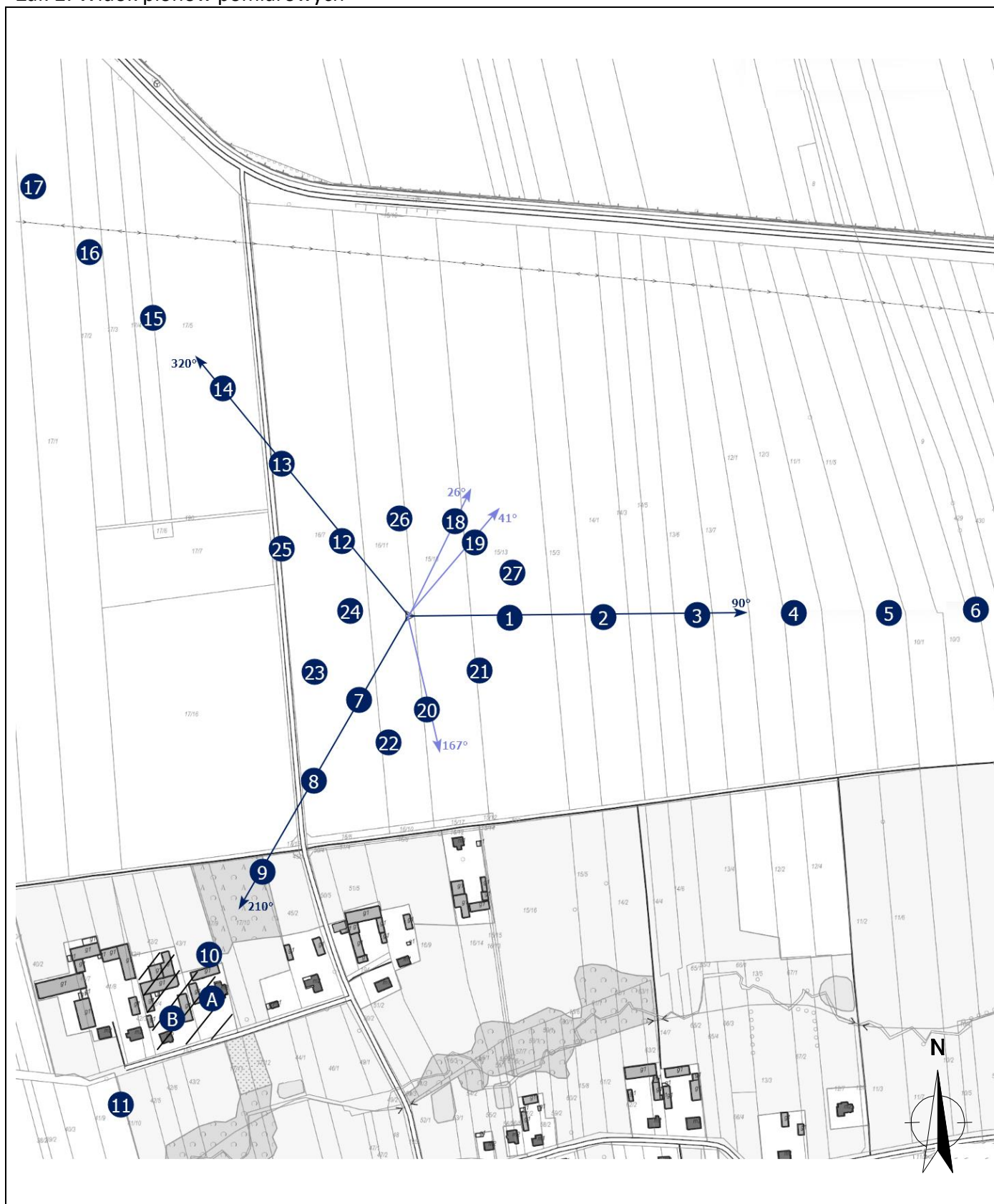
Załącznik 2. Widok pionów pomiarowych