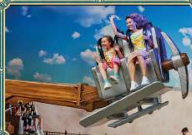
WSZYSTKIE ATRAKCJE ZNAJDUJĄ SIĘ W BUDYNKU = IDEALNY WYBÓR NA KAŻDĄ POGODĘ!