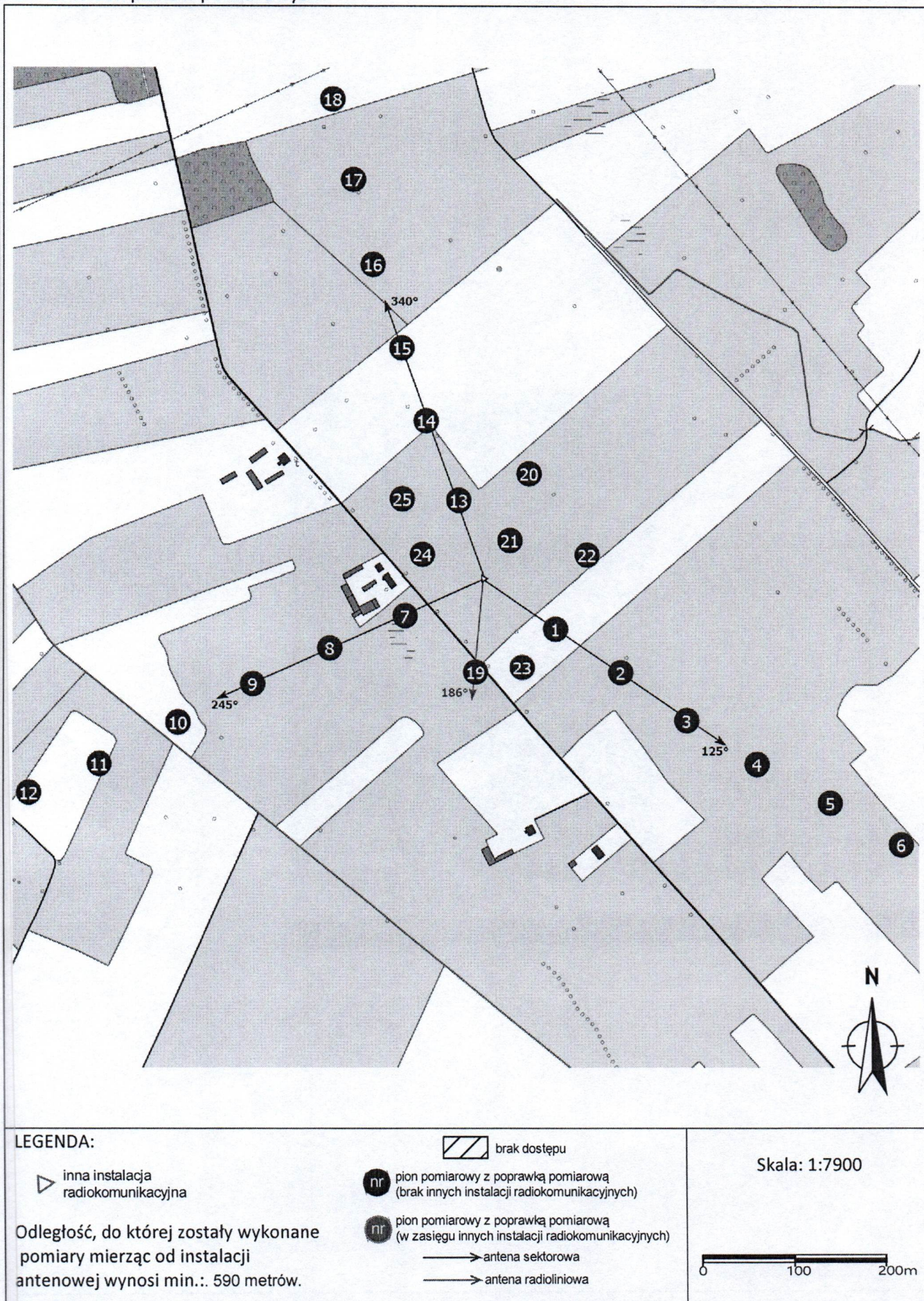
Załącznik 2. Widok pionów pomiarowych