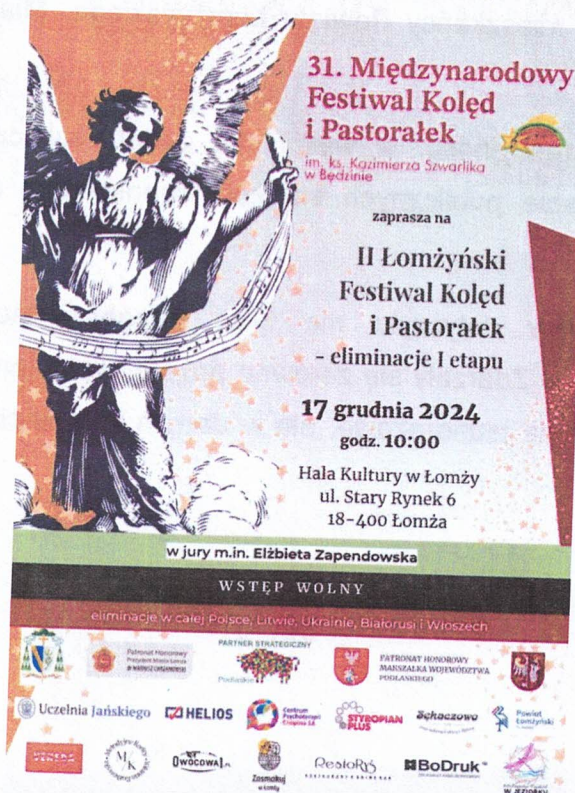
Ilustracja 14 Iwona Wykowska we współpracy z Uczelnią Jańskiego w Łomży; II Łomżyński Festiwal Kolęd i Pastorałek; plakat promocyjny