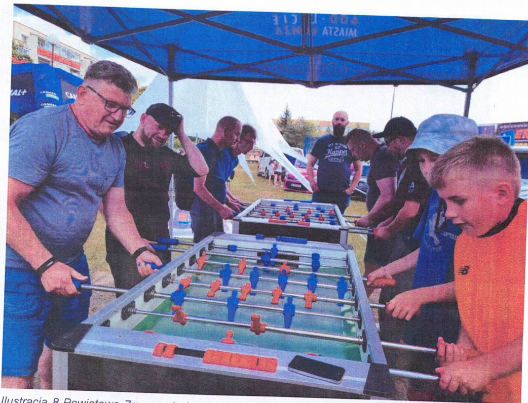
Ilustracja 8 Powiatowe Zrzeszenie Ludowe Zespoły Sportowe; Realizacja powiatowego kalendarza imprez sportowych Powiatowego Zrzeszenia LZS; Regionalne Igrzyska Sportowe

W okresie realizacji zadania, Powiatowe Zrzeszenie LZS było organizatorem licznych imprez sportowych, w których wzięło udział ponad 1000 zawodników i zawodniczek. Wydarzenia sportowe jakie przeprowadził beneficjent to Otwarte Turnieje Tenisa Ziemnego Par Deblowych, piłki nożnej i siatkowej, a także Indywidualne Mistrzostwa LZS w Szachach, Turniej Szachowy „Złota Wieża” o puchar Starosty Łomżyńskiego, Turniej Powiatowy w Tenisie Stołowym. Ponadto LZS był organizatorem dwóch lig – XIII Łomżyńskiej Ligi Tenisa Ziemnego (sezon letni) i Łomżyńskiej Ligi Tenisa Ziemnego (sezon zimowy).