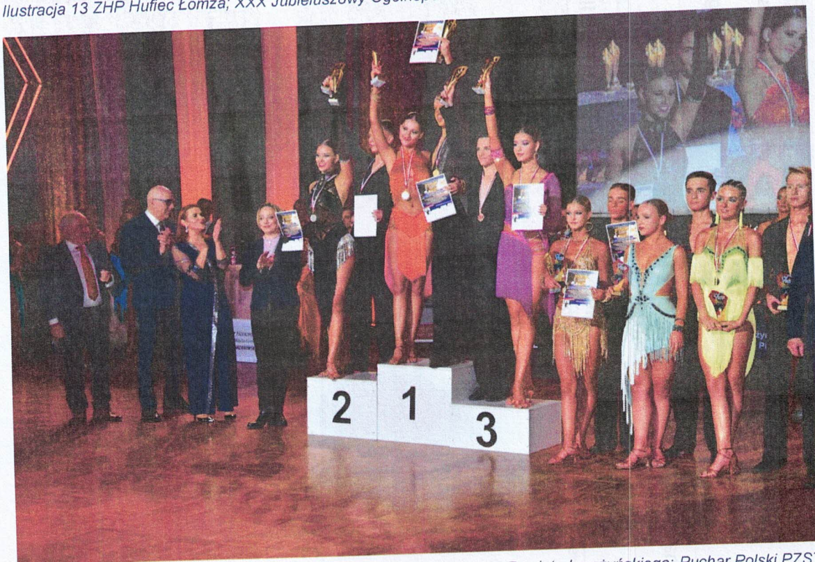
Ilustracja 12 Regionalny Ośrodek Kultury w Łomży Instytucja Kultury Powiatu Łomżyńskiego; Puchar Polski PZST Juniorów Starszych i Młodzieży Starszej w ramach XXVIII Ogólnopolskiego Turnieju Tańca Towarzyskiego, XXI Dziecięcej Gali Tanecznej o puchar Marszałka Województwa Podlaskiego, Starosty Łomżyńskiego, Prezydenta Miasta Łomży i Wójta Gminy Piątnica organizowanego z okazji 35-lecia działalności Klubu Tańca Towarzyskiego Sportowego „AKAT”