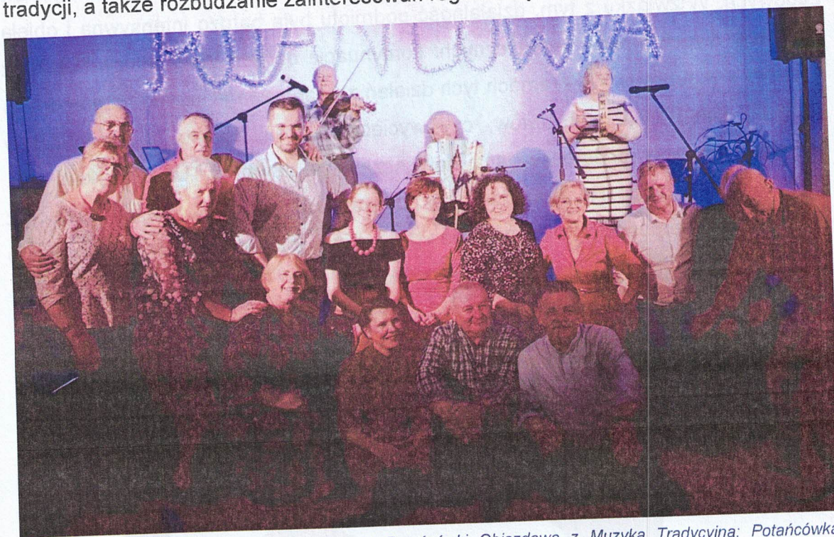
Ilustracja 3 Stowarzyszenie "Miód na Serce"; Potańcówki Objazdowe z Muzyką Tradycyjną; Potańcówka Andrzejkowa

W ramach zadania, podmiot zorganizował dwie wiejskie potańcówki: „Potańcówkę w Podgórzu” – 11 października 2024 r. oraz „Potańcówkę Andrzejkową” w Gminnym Ośrodku Kultury w Zbójnej – 30 listopada 2024 r. W wydarzeniach łącznie wzięło udział około 160 uczestników w różnym wieku. Podczas imprez, do tańca grały następujące zespoły: Kapela Dzikie Sad, Kapela z Nowogrodu, Kapela Grzesia. Projekt miał na celu ożywienie i popularyzację ludowego muzykowania, przekazywanie i podtrzymywanie tradycji, a także rozbudzanie zainteresowań regionalną tradycją muzyczną.