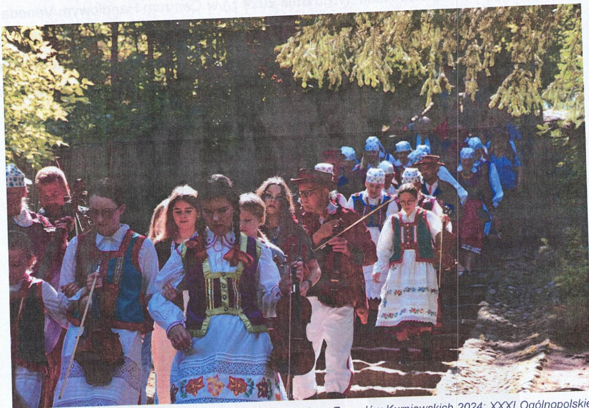
Ilustracja 5 Fundacja "Sztuk i Dialogu"; Ogólnopolski Konkurs Zespołów Kurpiowskich 2024; XXXI Ogólnopolskie Dni Kultury Kurpiowskiej w Nowogrodzie

Konkurs został zrealizowany podczas XXXI Ogólnopolskich Dni Kultury Kurpiowskiej w Nowogrodzie (16 czerwca 2024 r.). Konkurs przyczynił się do promocji lokalnych twórców, gawędziarzy ludowych, miejscowych kapel i zespołów ludowych co wpłynęło na popularyzację folkloru i kultury kurpiowskiej. Zadanie zgromadziło ok. 130 wykonawców.