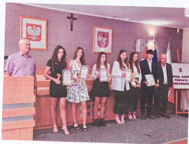
Ilustracja 6 Powiatowy Szkolny Związek Sportowy; Organizowanie i prowadzenie systemu współzawodnictwa sportowego dzieci i młodzieży szkół z terenu powiatu łomżyńskiego; podsumowanie sezonu 2023/2024

Realizując zadanie, Powiatowy SZS zorganizował liczne zawody sportowe dla 33 dzieci i 27 młodzieży szkolnej, w których udział wzięło szacunkowo 4 900 osób z 27 szkół. Rywalizowano w 12 dyscyplinach sportowych, które cieszą się największą popularnością w regionie. Efektem realizacji zadania jest wzrost świadomości dotyczącej zdrowego stylu życia i potrzeby aktywnego spędzania czasu, czego namacalnym dowodem są liczne medale zdobyte przez młodych zawodników i zawodniczki z terenu Powiatu Łomżyńskiego