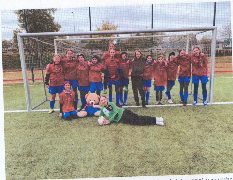
Ilustracja 7 Gminny Klub Sportowy Forty Piątnica; Organizacja szkoleń i udział w zawodach sportowych, mających na celu osiągnięcie wyników sportowych na różnych poziomach rozgrywek;

W ramach zadania, GKS FORTY prowadziły regularne zajęcia sportowe dla dzieci i młodzieży oraz zapewniły zawodniczkom udział w rozgrywkach ligowych. Działania te przyczyniły się do popularyzacji wśród młodych osób zdrowego stylu życia i aktywnego spędzania czasu wolnego. Trening sportowy stanowił także platformę do zaszczepiania w uczestnikach pozytywnych cech takich jak sumienność, punktualność, obowiązkowość.