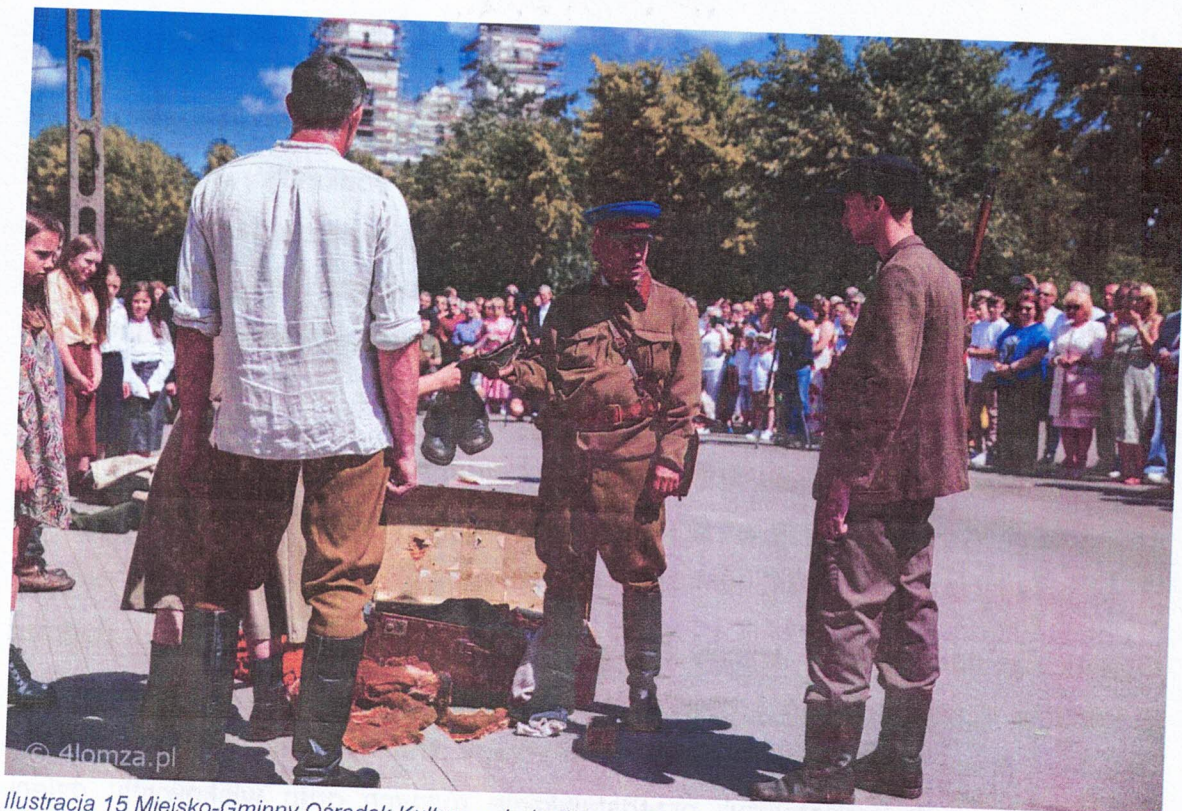
Ilustracja 15 Miejsko-Gminny Ośrodek Kultury w Jedwabnem; „Ocalić od zapomnienia” (rekonstrukcja historyczna)