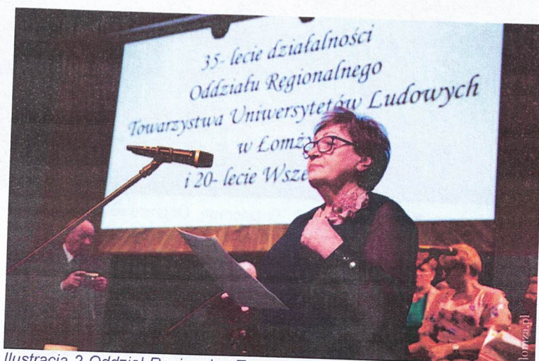
Ilustracja 2 Oddział Regionalny Towarzystwa Uniwersytetów Ludowych w Łomży z siedzibą w Marianowie; Złoty Wiek - ciekawy i radosny - edycja 21; Gala 35-lecia działalności Oddziału Regionalnego TUL w Łomży

W 2024 r. organizacja świętowała 35-lecie działalności oraz 20-lecie funkcjonowania Wszechnicy TUL pn. „Tulowskie Spotkania”. Oddział był także organizatorem Ogólnopolskiego Spotkania Wiosennego dla członków Towarzystwa Uniwersytetów Ludowych. W związku z tym, działalność podmiotu była bardzo intensywna i objęła realizację dwóch bloków tematycznych: kontynuację działań Wszechnicy TUL oraz obchody ww. jubileuszy. W ramach tych działań zorganizowano szereg różnorodnych spotkań, konferencji, warsztatów, czy wycieczek; zrealizowano m.in.: warsztaty wokalne, wystawę podsumowującą dotychczasowy dorobek TUL-u, wykład dot. zdrowia psychicznego. Realizacja zadania pozwoliła zaktywizować osoby starsze oraz podnieść świadomość dot. wyzwań jakie stoją przed seniorami, a także w jaki sposób podnieść jakość życia osób w podeszłym wieku.