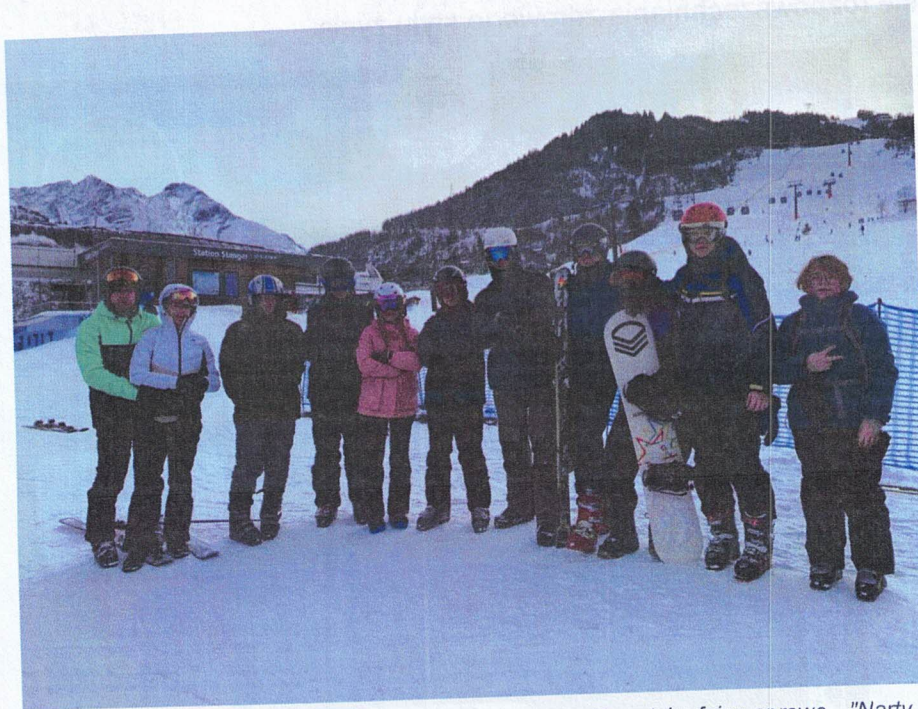
Ilustracja 11 Parafia pw. Miłosierdzia Bożego w Łomży; Turystyka fajna sprawa - "Narty z Jezusem"

Dofinansowanie zadania pozwoliło na organizację wyjazdu dzieci i młodzieży do Kaprun w Austrii w styczniu 2024 r. Celem organizatorów była promocja aktywności fizycznej, budowanie poprawnych relacji społecznych oraz wyrównywanie szans wśród uczestników pochodzących z różnych środowisk.