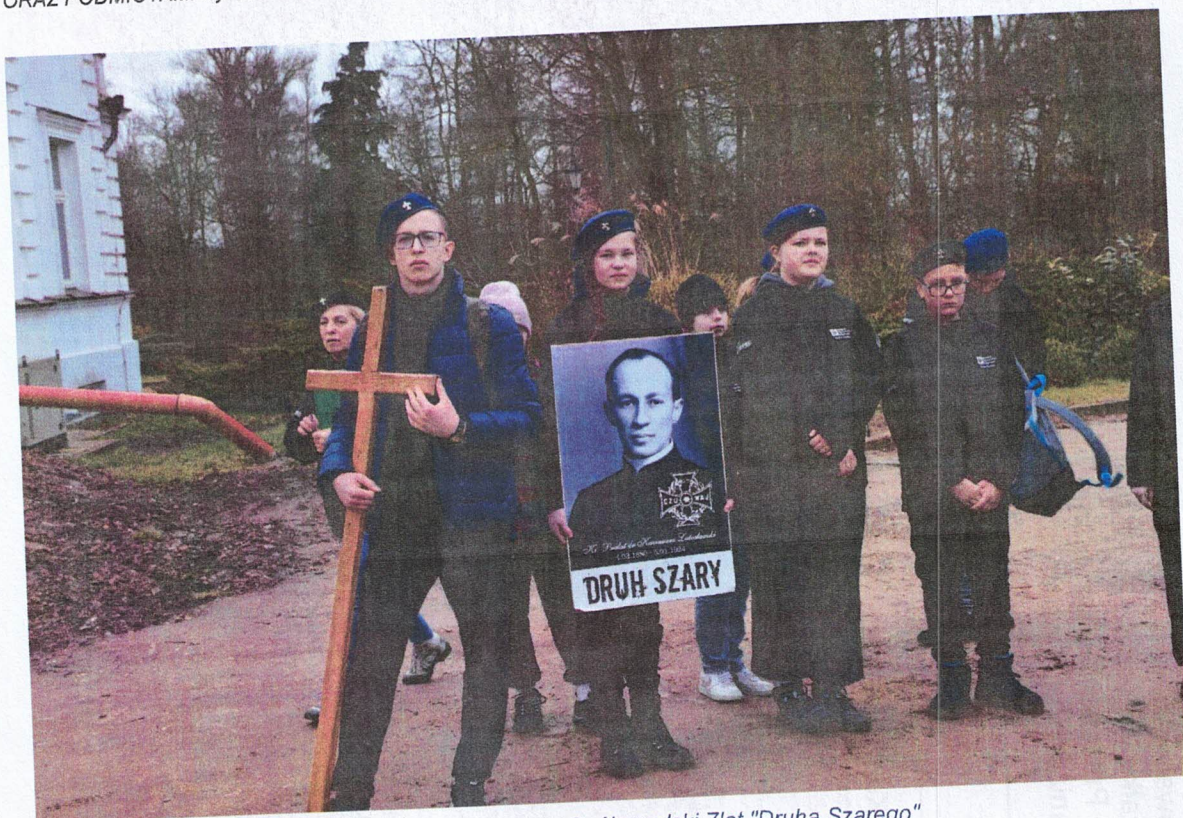
Ilustracja 13 ZHP Hufiec Łomża; XXX Jubileuszowy Ogólnopolski Zlot "Druha Szarego"