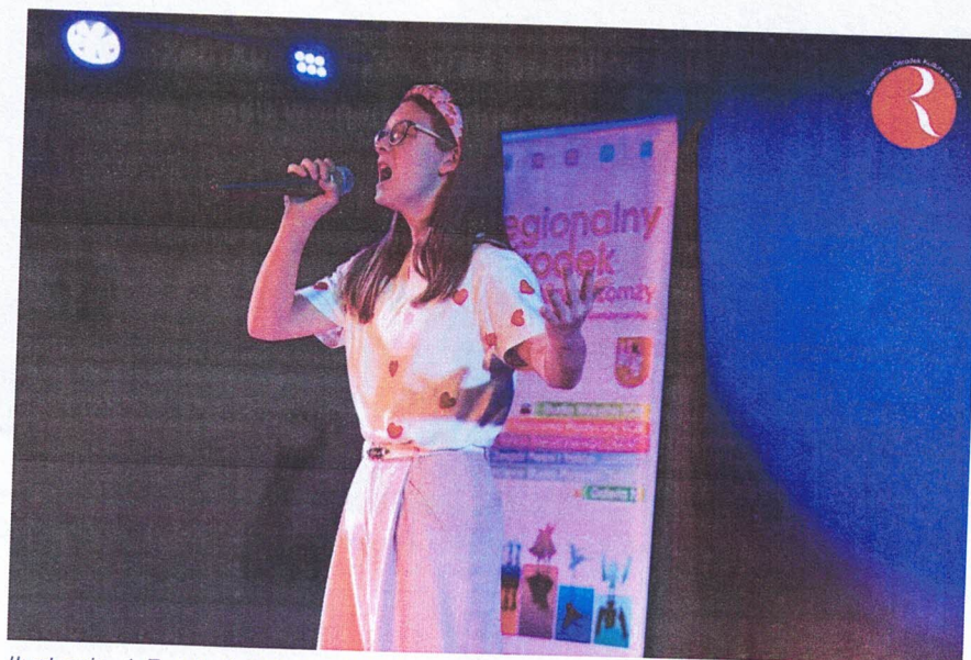
Ilustracja 4 Fundacja „Sztuk i Dialogu”; Piosenka jest dobra na wszystko - XI cykl festiwali tematycznych; XXXII Giełda Piosenki Dziecięcej i Młodzieżowej „Scena Młodych Wokalistów”

W ramach zadania publicznego zrealizowano dwa festiwale tematyczne: XXXII Giełdę Piosenki Dziecięcej i Młodzieżowej „Scena Młodych Wokalistów” (15 listopada 2024 r.) w siedzibie Regionalnego Ośrodka Kultury w Łomży oraz XIV Festiwal Piosenki Świątecznej „Gwiazdkowe Nutki” (7 grudnia 2024 r.) w Centrum Handlowym Veneda. Łącznie w imprezach udział wzięło 156 uczestników co jest rekordowym wynikiem. Projekt miał na celu integrację dzieci i młodzieży z różnych środowisk wokół kreowania i zaspokajania potrzeb kulturalnych oraz kształtowanie pozytywnych wzorców jeśli chodzi o wypełnianie czasu wolnego wartościowymi formami.